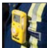
Facile da indossare