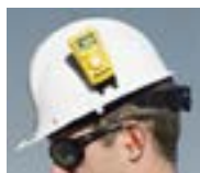
Attacco per elmetto