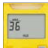
Di facile lettura