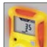
Facile da individuare