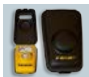
Alloggiamento per ibernazione